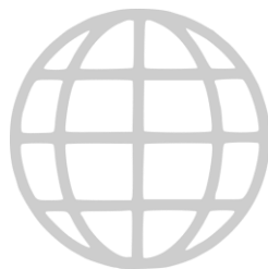
LAS BRECHAS POR REGIONES