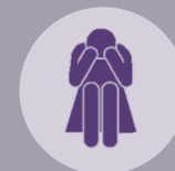
Dimensión Salud Una de las más cruciales