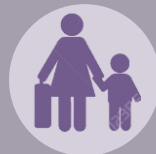
Dimensión Económica Una de las más cruciales