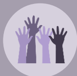
Dimensión Política la más amplia brecha