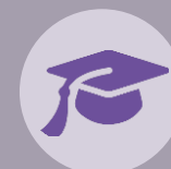
Dimensión Educación La de mayor avance

TOP 10 por cercanía a cerrar la brecha 1. Islandia 2. Noruega 3. Finlandia 4. Ruanda 5. Suecia 6. Nicaragua 7. Eslovenia 8. Irlanda 9. Nueva Zelanda 10. Filipinas